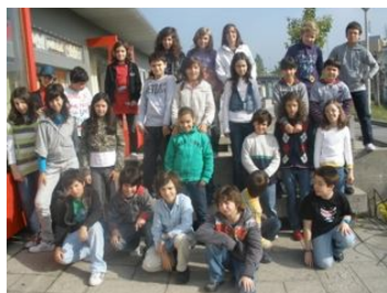
A turma do 5ªA

Falta apenas dizer que este projecto é um dos projectos desenvolvidos no âmbito do Projecto de Empreendedorismo «CONSTRUIR CAMINHOS», onde tem o nome «A Caminho das Histórias».